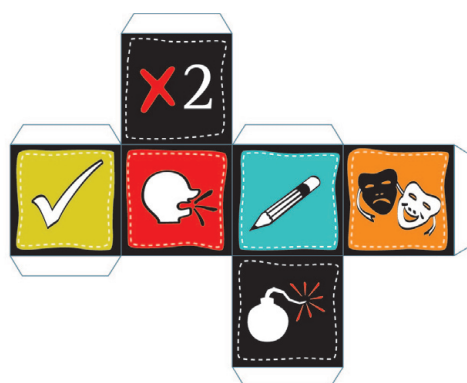
Figure 7 The specific dice.

Lo scopo del gioco è di riuscire ad uscire dal cratere prima che il vulcano erutti, partendo dalla camera magmatica. È una specie di gioco dell'oca che consiste nel risalire il vulcano attraverso il condotto, rispondendo, di volta in volta, in maniera corretta, alle domande che capitano pescando la carta corrispondente al lancio del dado. La stanza bonus, che è posta a metà percorso, permette di accelerare la salita, passando da 5 a 7, qualora si diano due risposte