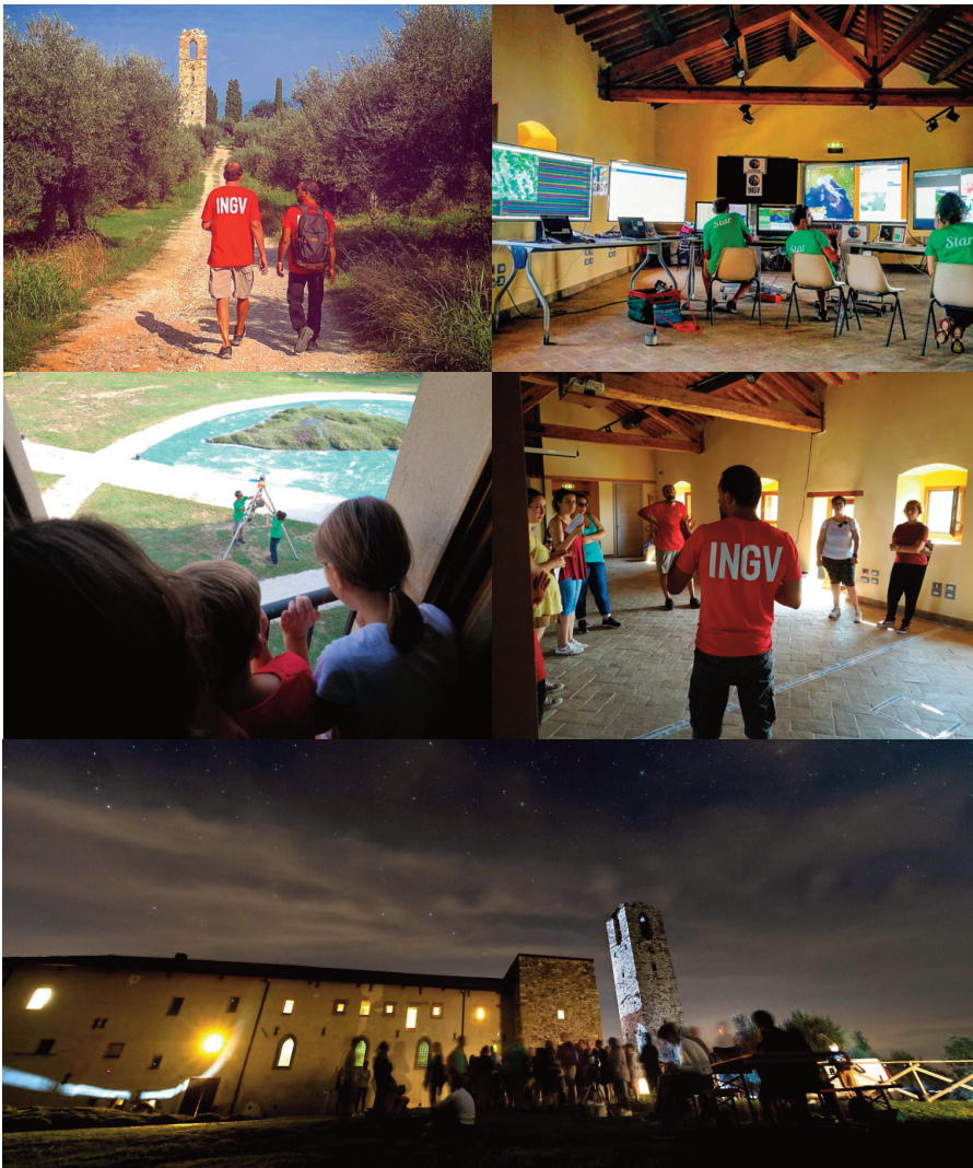
Figura 12 La replica della Sala di Monitoraggio Sismico e Allerta Tsunami installata presso il Centro “Cambiamento Climatico e Biodiversità degli Ambienti Lacustri e Aree Umide” di ARPA Umbria. In alto a sinistra: il sentiero che porta ai i ruderi della chiesa di S. Secondo e adiacente ex convento degli Olivetani che ospita il Centro ARPA Umbria. A destra (alto e centro): la Sala di Monitoraggio allestita nel Centro ARPA Umbria. Al centro, a sinistra: esperimento dimostrativo sulla propagazione delle onde sismiche. In basso: vista notturna del convento degli Olivetani.

Figure 12 Replica of the “Seismic Monitoring room and Tsunami warning centre” installed at the “Cambiamento Climatico e Biodiversità degli Ambienti Lacustri e Aree Umide” Center of ARPA Umbria. Upper left: the track leading to the ruins of San Secondo church and Olivetani convent hosting the ARPA Umbria Center. Right: the Seismic Monitoring room. Center left: the artificial reproduction of an earthquake. Bottom centre: a night view of the Olivetani convent.