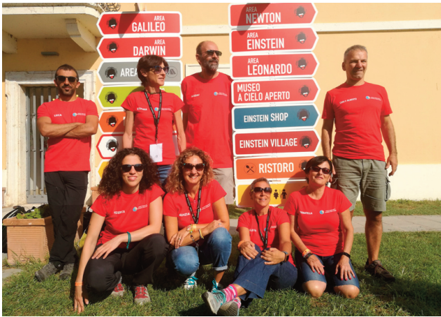
Figura 5 La squadra dell'INGV che ha progettato e realizzato le attività sull'Isola.

Figure 5 The INGV team realizing the Island activities.