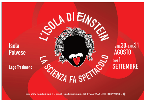
Figura 1 Logo dell'evento "L'Isola di Einstein 2019".

Le dimostrazioni, gli spettacoli e le performances a tema scientifico sono presentati da esperti scienziati, comunicatori ed artisti di strada, provenienti da diverse parti del mondo che si ritrovano in Umbria, nel meraviglioso contesto dell'isola Polvese del Lago Trasimeno, per un Evento unico nel panorama nazionale ed internazionale. L'isola presenta un ambiente particolarmente suggestivo, frutto di un'armoniosa integrazione tra paesaggio naturale spontaneo, sapienti coltivazioni ed interessanti memorie storico-architettoniche dai Romani ai nostri giorni. Gli ampi spazi disponibili sull'Isola sono stati utilizzati per creare varie aree tematiche dedicate alle attività di divulgazione scientifica, ai giochi, alle dimostrazioni ed agli incontri a tema.