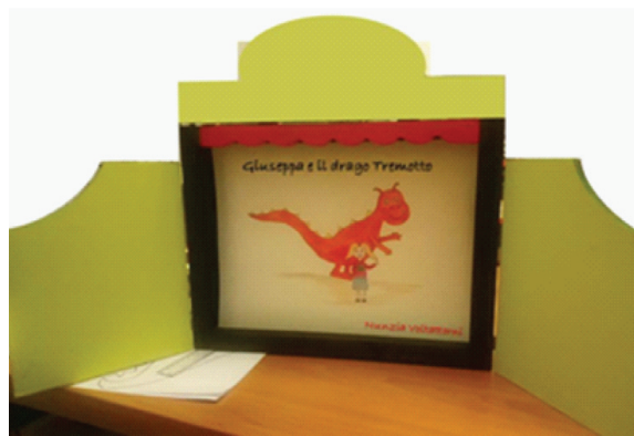
Figura 11 Attività creativa per costruire il proprio drago.

Figure 10 Japanese theatre ( butai ) to tell the “Giuseppa e il drago Tremotto” tail using kamishibai technique.