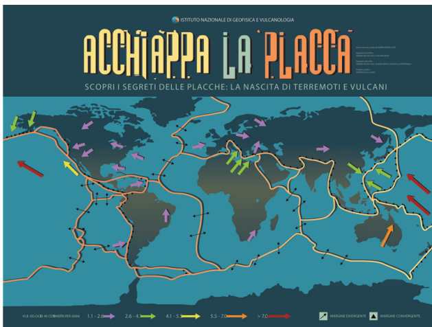
Figura 9 Tabellone di "Acchiappa la Placca".

I punti verranno segnati con un segnapunti che riprende i colori del tabellone. Ogni squadra ha 30 secondi di tempo, segnati da una clessidra, per poter posizionare correttamente le pedine sul tabellone. Vince la squadra che ha ottenuto il punteggio maggiore.