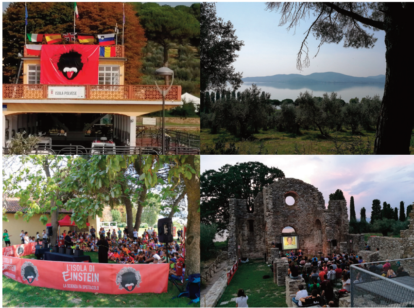
Figura 3 In alto da destra a sinistra: il molo d'approdo ed il panorama, visto dall'isola, del lago e della costa umbra. In basso da sinistra a destra: le attività sui prati e tra i ruderi della chiesa di San Secondo, suggestivo scenario.

Figure 3 Top from right to left: the landing pier and the view, seen from the island, of the Umbrian coast and the lake. Bottom from left to right: activities on the lawns and among the ruins of the church of San Secondo, an evocative setting.