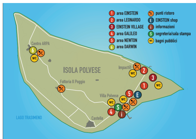
Figure 4 Schematic map of the Polvese Island with location of the activities.

Le attività sono state ideate e realizzate da personale ricercatore e tecnico della sede INGV di Roma, con consolidata esperienza nel settore della divulgazione scientifica (vedi Tabella 2 e Figura 5).