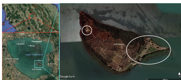
Figura 2 L'isola Polvese (A) è una delle tre isole che emergono dal Lago Trasimeno (B) localizzato in Umbria, Italia centrale (C).

è il più esteso lago dell'Italia centrale, nella parte meridionale emerge l'isola Polvese che raggiunge i 320 m s.l.m. (Figura 2). L'Isola è in gran parte ricoperta da oliveti di varie specie, gestiti ed utilizzati per la produzione olearia, e da specie vegetali tipiche degli ambienti mediterranei (roverelle, ornielli ed alaterni). Il suo versante settentrionale è occupato da una fitta lecceta ad alto fusto (la Lecceta di San Leonardo). Nel sottobosco prevalgono viburno, alloro, pungitopo e ligustro. Completano il paesaggio i canneti delle aree costiere e gli ampi prati dove l'Evento realizza le proprie attività utilizzando anche le strutture alberghiere necessarie alla sistemazione logistica delle decine di volontari, operatori e performers che abitano l'isola nei tre giorni in cui si svolge la manifestazione. Gli altri manufatti presenti sono: la fortezza difensiva di età medievale, una masseria che ospita la fattoria e l'ostello e, nella parte settentrionale, i ruderi della chiesa di San Secondo ed il Monastero Olivetano. Quest'ultimo, ristrutturato negli ultimi anni, ospita laboratori e uffici del Centro "Cambiamento Climatico e Biodiversità degli Ambienti Lacustri e Aree Umide" di Arpa Umbria (Agenzia Regionale per la Protezione Ambientale dell'Umbria). L'ARPA Umbria ha messo a disposizione ampi spazi per la realizzazione delle attività dell'INGV nell'ambito dell'Evento (Figura 3).