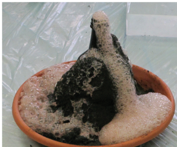
Figure 8 Simulation of an effusive eruption.