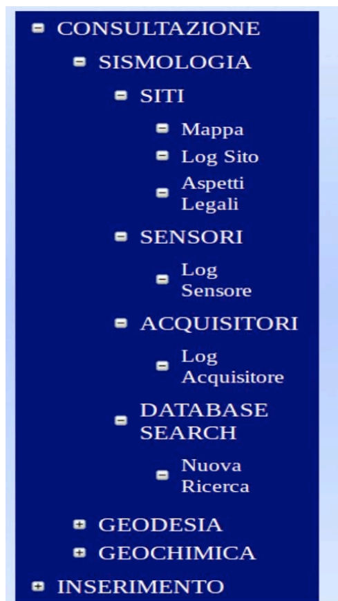
Figura 3. Principali sottomenù della sezione “Consultazione” di “Sismologia”.