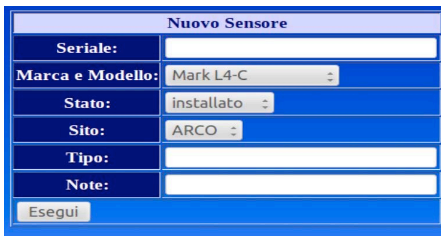
Figura 14. Pagina web di inserimento di un nuovo sensore.

Cliccando su “Sensori” e poi sul link “Nuovo sensore” si aprirà una nuova pagina web che consentirà di inserire un nuovo sensore all’interno del database (fig. 14). Per ogni nuovo sensore è necessario specificare il seriale e scegliere da una serie di menù a tendina la marca e il modello, lo stato (installato, magazzino) e l’eventuale stazione su cui deve essere installato.