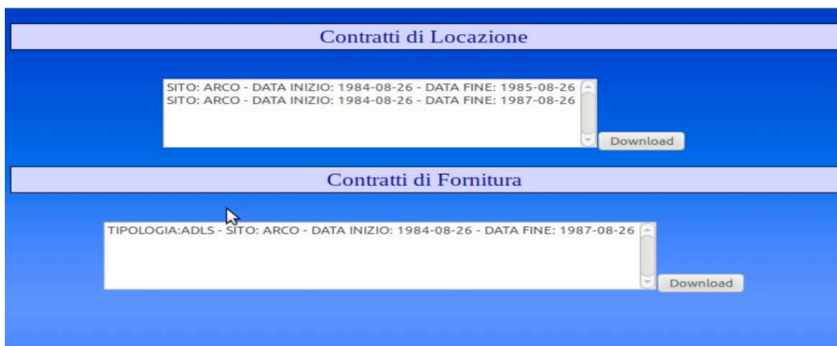
Figura 6. Lista dei Contratti di Locazione e Contratti di Fornitura.