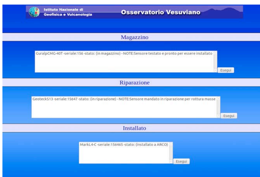
Figura 7. Lista dei sensori catalogati per “stato”.

Nella lista “Magazzino” ad esempio sono presenti i sensori ordinati da fornitori e che devono essere sottoposti a collaudo prima dell’installazione, oppure che sono danneggiati e in attesa di essere spediti per la riparazione. Nella lista “Riparazione” sono presenti i sensori spediti in riparazione, il cui guasto è specificato nelle note. Infine nella lista “Installato” sono presenti tutti i sensori installati alle stazioni.