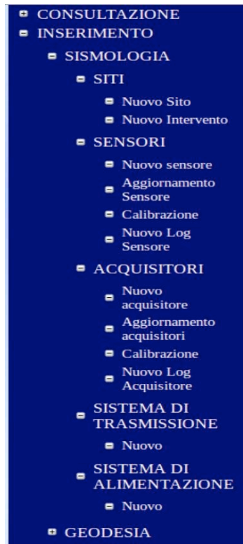
Figura 11. Sottomenù della sezione “Inserimento di “Sismologia”.