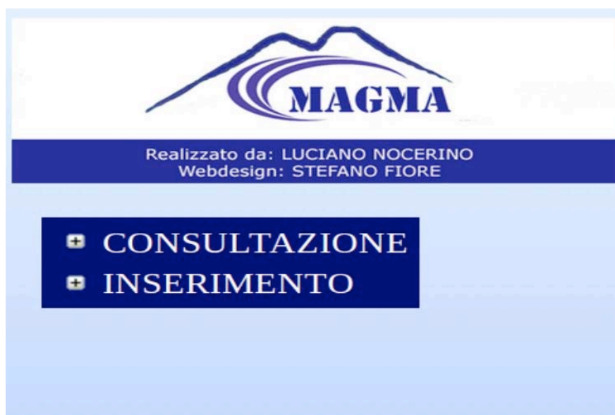
Figura 2. Menu principale di MAGMA.